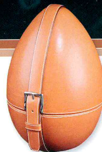
Leather and gold watch and jewellery box, by TECHNEW