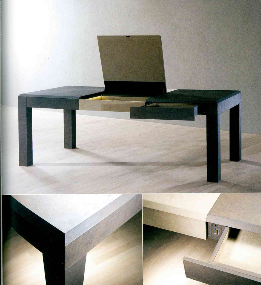
Sculpture active et fonctionnelle en bois précieux et Alcantara avec tiroirs secrets, par ART OF SECRET