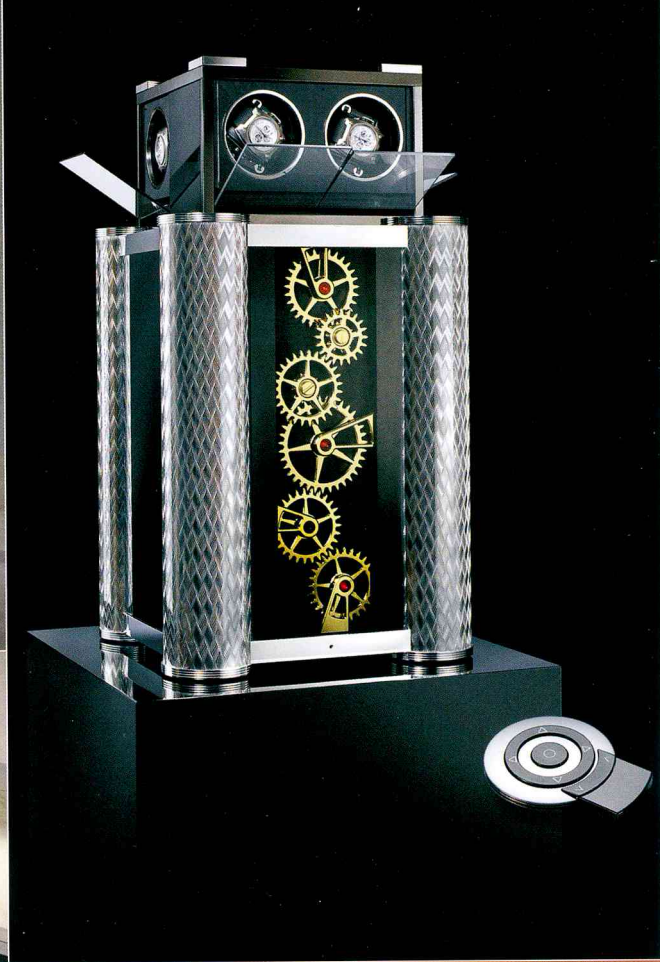
Meuble remontoir à complication en or et palladium à contrôle télécommandé, par RDI