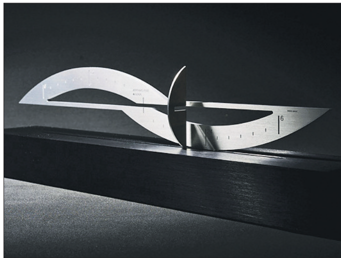
A5-01. Cette horloge de table propose une lecture du temps différente, basée sur la course du soleil. Son prix est de 1210 francs.

Le prototype de l'horloge présenté, FiveCo entre aujourd'hui